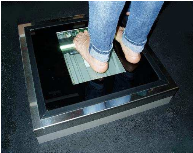
Registro de la huella

Escáner digital para el estudio de la huella plantar en carga Diseño personalizado de la ortesis plantar